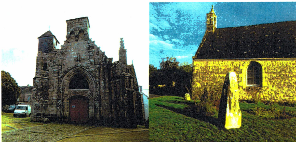
L'église de Saint-Théleau